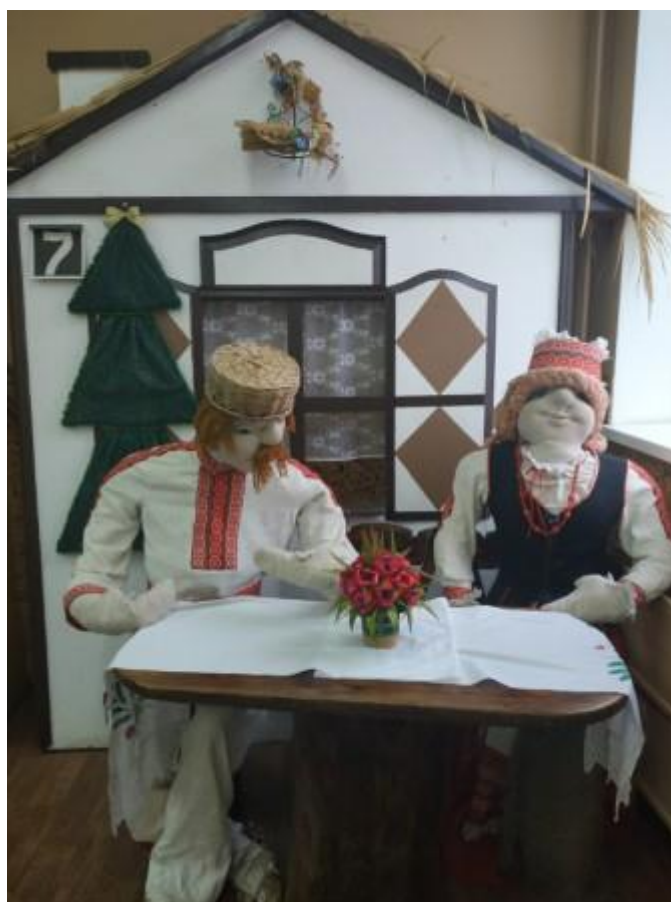
Этнаграфічны куток. ДУА “Сярэдняя школа № 7 г. Брэста