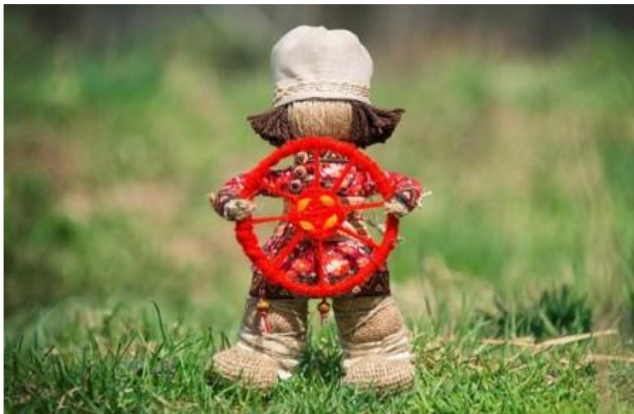
Як зрабіць ляльку “Спірыдон- сонцаварот”