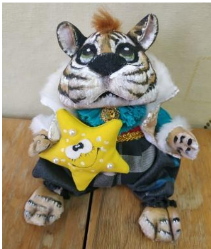
Качура У. 8-Д клас