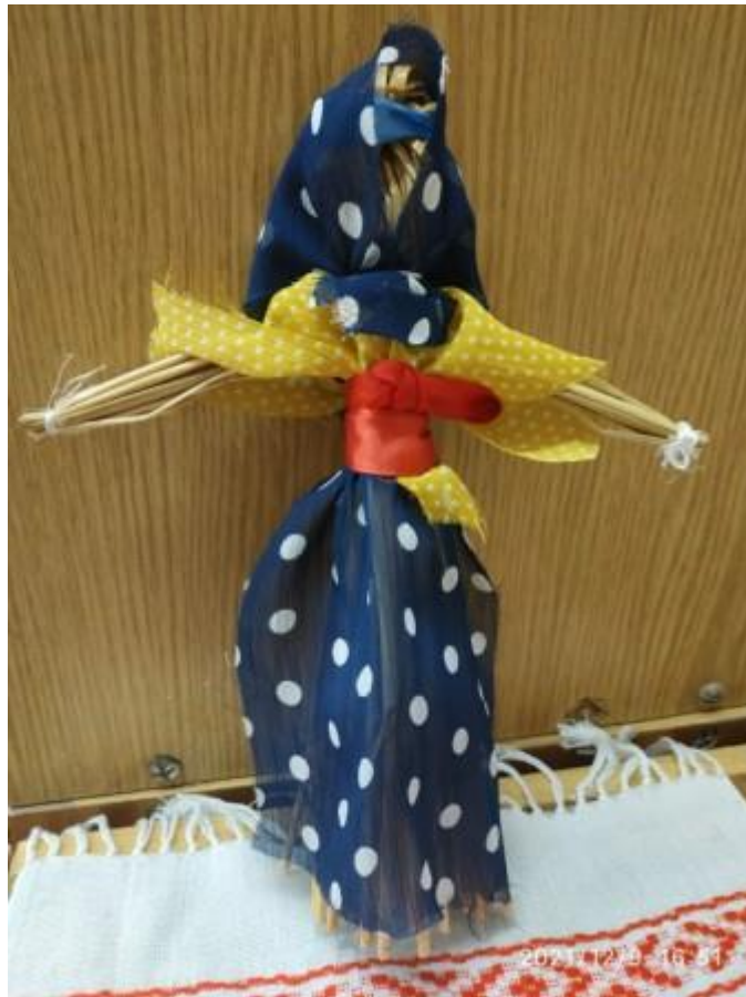
Казейка М. 6-Д клас