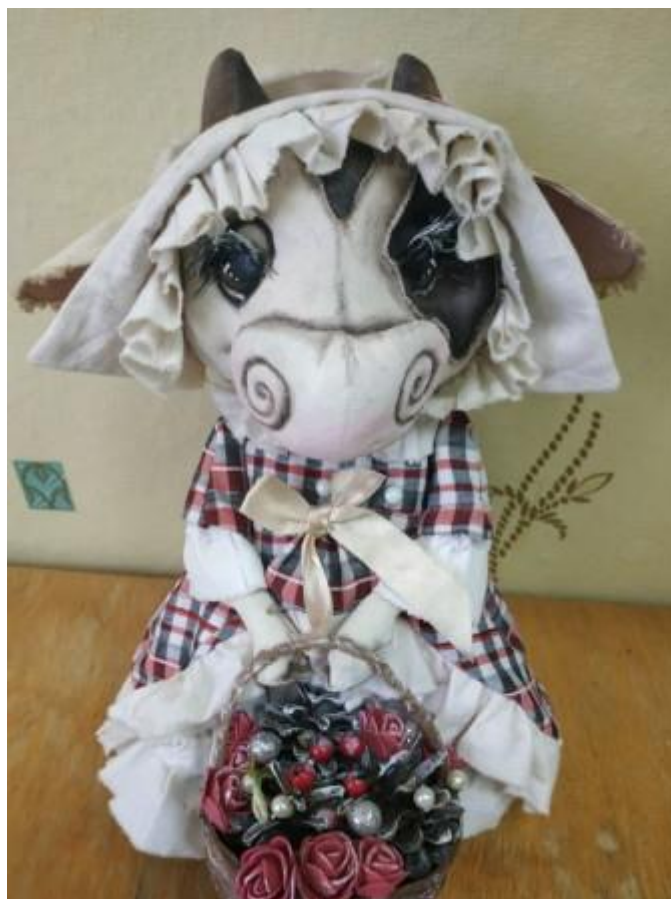
Качура У. 8-Д клас