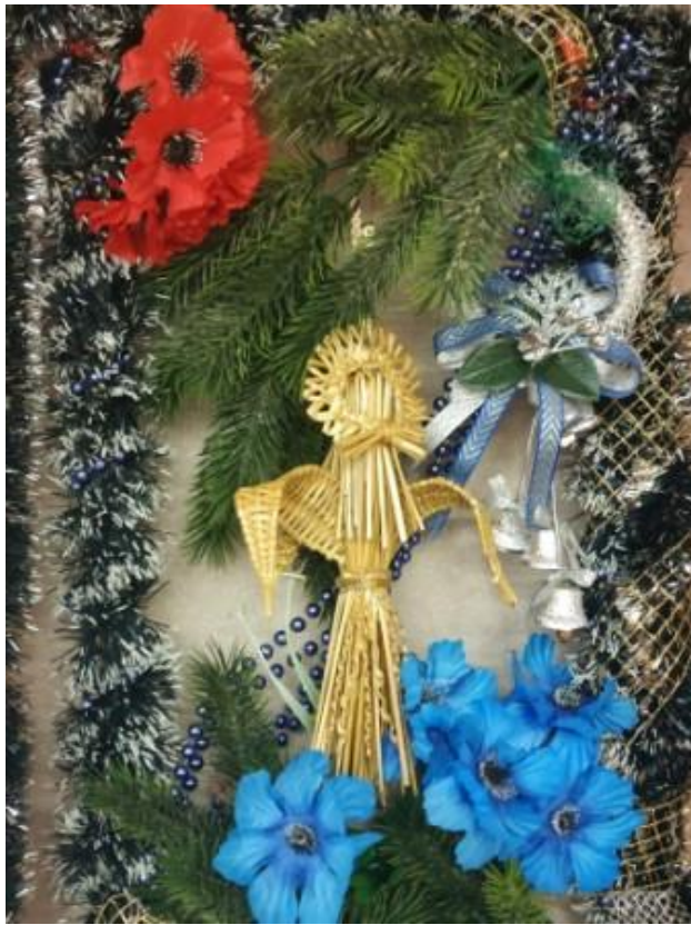
Баранчыкава Д. 11- Г клас