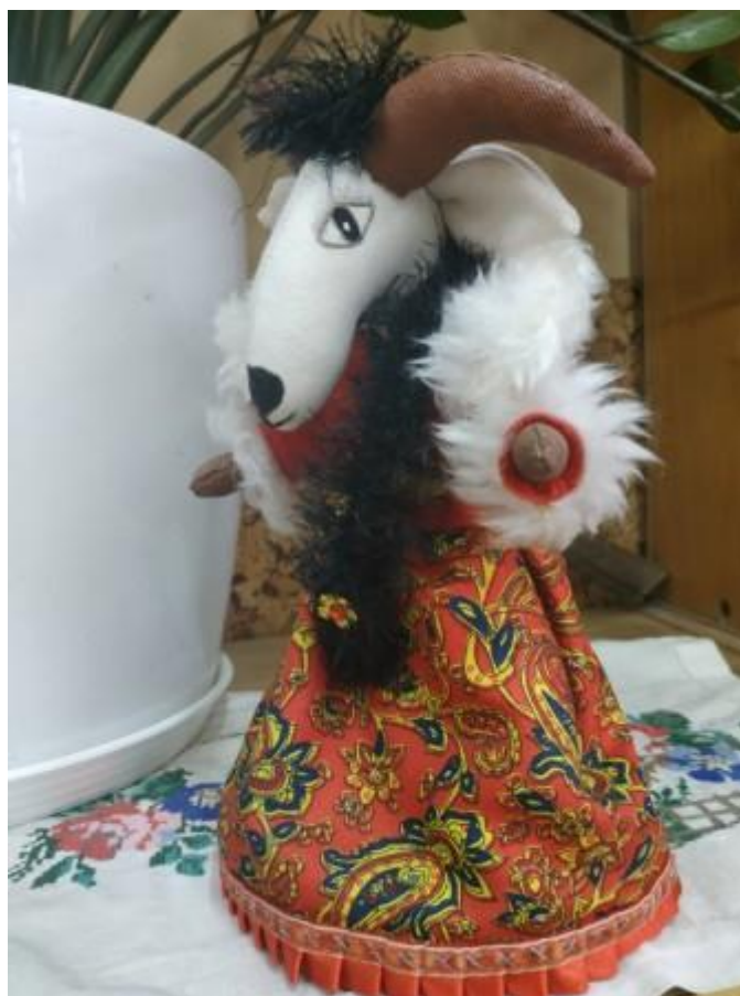
Жыліч К. 8-Б клас